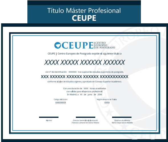
Titulación Profesional CEUPE® - Centro Europeo de Postgrado no conduce a la obtención de un título con validez oficial

Todos los alumnos matriculados en CEUPE dependiendo del plan académico podrán acceder a estos tipos de Titulación de Postgrado.